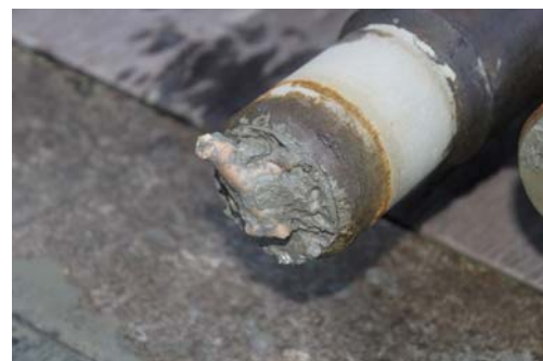
Koralle schon im Core Catcher – ein guter Kern!