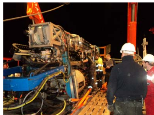
Ausladen der MeBo Kerne bei Nacht.