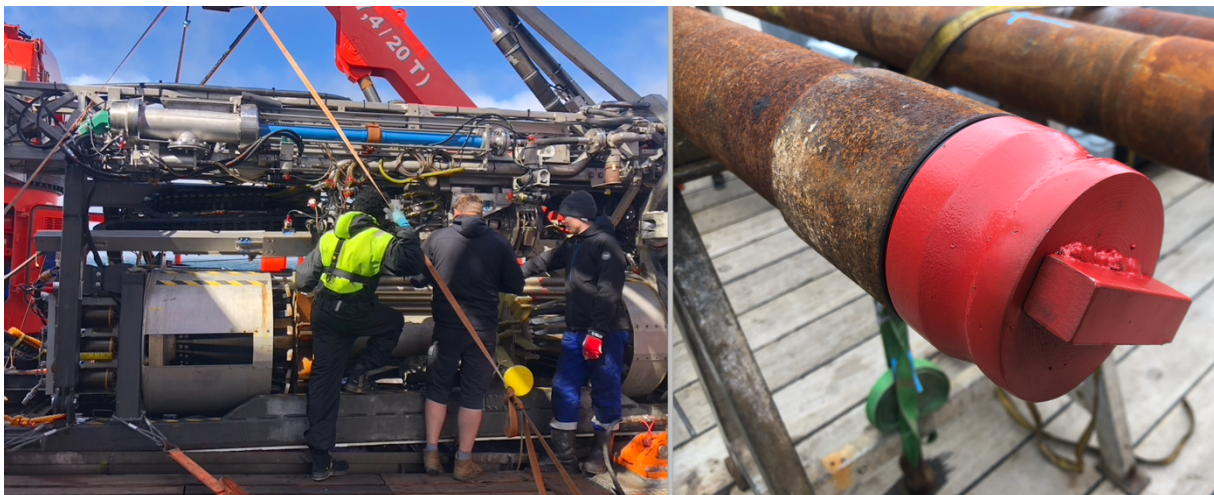
Abbildung 2 Links: Zwischen zwei Bohrungen wird das MeBo70 gewartet und mit neuen Bohrstangen beladen. Rechts: Einfacher Bohrlochverschluss, der innen ein autonomes Temperaturmeßsystem montiert hat. Diese Bohrstange wird als letzte gesetzt, ehe das MeBo abhebt; der Verschluss wird in zwei Jahren per Tauchroboter wieder abgeborgen.

Sowohl die Osmo-Sampler als auch die Bohrlochverschlüsse zum Temperatur-Monitoring sind abschraubbar (Abb. 2) und können mit dem Tauchroboter auf späteren Expeditionen geborgen und gegen andere Observatorien ausgetauscht werden.