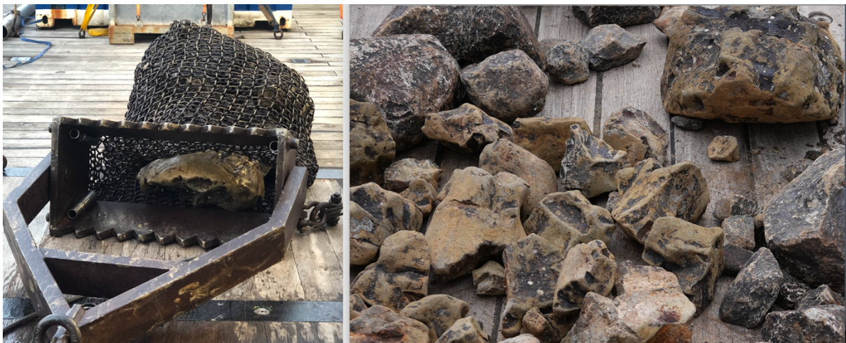
Abbildung 2 Links: Geborgene Dredge, die sehr nahe der Rückenachse in einem lebensfeindlichen Milieu auslag. Rechts: Zahlreiche Basaltstücke mit unterschiedlicher Porigkeit und Alteration harren noch der Beschreibung.

Die Perioden zwischen den MeBo-Einsätzen werden genutzt, um mit einem Transekt an Schwerloten und Temperaturmessungen die Spreizungsachse mit dem Squid Pond zu verbinden und die Rückenflankenprozesse besser zu charakterisieren. In der betrachteten Zeitscheibe der Erdgeschichte, d.h. die letzten ca. 3 Mill. Jahre, sehen wir thermische Variabilität in den Daten, unterschiedlich verfestigte und alterierte Sedimente, variable Porenwasserzusammensetzungen, sowie unterschiedliche Anteile der magmatischen Komponenten. Erst Analysen in den Heimatlaboren werden jedoch Schlüsse zulassen, inwieweit dieses Material von der Rückenachse oder z.B. von Island kommt. Um unterschiedlicher Magmenzusammensetzung oder Änderungen der gesteinsphysikalischen Eigenschaften der Ozeankrustenbasalte auf die Spur zu kommen, werden komplementär kurze Dredgenzüge parallel zu Krustenalter-Isolinien gefahren (Abb. 2). Erste Ansprache zeigt, dass frische oder oberflächlich alterierte Basalte dominieren, und seltener blasige Varietäten gefunden werden. Vereinzelt finden sich andere Lithologien (vermutlich glaziale Dropstones).