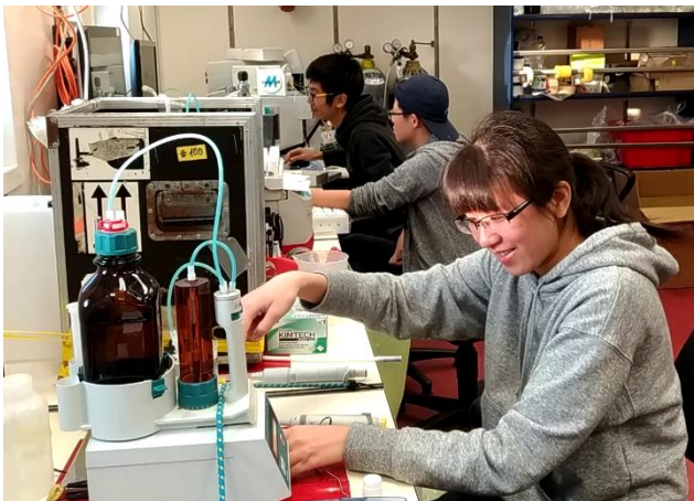
Abbildung 1: Blick ins Trockenlabor 1 von FS SONNE, in dem die Chlorid-, Sulfat-, Ammonium- und Schwefelwasserstoffgehalte des Porenwassers nach jeder Bohrung analysiert werden.