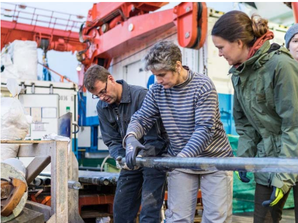
Abbildung 1: MeBo200 Sedimentkern, der gerade von den Wissenschaftlern aus dem Kernrohr gezogen wurde und zur weiteren Bearbeitung ins Labor getragen wird.

Nachdem das Meeresbodenbohrgerät MeBo200 am Sonntagabend kurz vor Mitternacht an Deck kam, hatten die Wissenschaftler die ganze Nacht bis zum Montagvormittag alle Hände voll zu tun, die Sedimentkerne sachgemäß zu verarbeiten. Insgesamt kamen 36 Kernsegmente aus dieser fast 144 m tiefen Bohrung in die Bearbeitung (Abb. 1 und 2). Obwohl wir mit der Bohrung den bodensimulierenden seismischen Reflektor erreichten, haben wir an der Basis keine direkten Hinweise auf Methanhydrate gefunden. Dies mag wohl auch an der sehr feinkörnigen Zusammensetzung der Sedimente der tiefsten 40 Bohrmeter liegen. In dem Abschnitt von 60-100 m Sedimenttiefe gab es zwar mehrere Hinweise auf Vorkommen von Methanhydrat, aber leider noch kein unzersetztes Gashydrat. Mit der Infrarotkamera konnten wir eine deutliche Temperaturanomalie in einem Kern dieser Tiefen feststellen, die eindeutig auf den endothermen Zersetzungsprozess von Methanhydrat hinwies. Weitere Indikatoren waren „suppige“, wasserhaltige Gefüge in manchen Kernsektionen, die sehr wahrscheinlich durch die Wasserfreisetzung von sich zersetzenden Gashydraten entstanden. Dieser Abschnitt von 60-100 m in der Bohrung scheint generell grobkörniger zu sein, so dass in einzelnen Lagen der Porenraum möglicherweise durch Methanhydrate zementiert war. Das hervorragende Sonic-Log, welches das gesamte Bohrloch abdeckt, zeigt in diesem Abschnitt eine deutlich höhere P-Wellen-Geschwindigkeit, die wunderbar mit den Änderungen in der Lithologie korreliert.