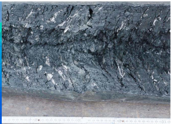
Abbildung 5: Kernabschnitt des Schwerelotes GeoB22606 zeigt die eiszeitlichen Seeablagerung, die durch Eisenreduktion und Ausfällung von Eisenmonosulfiden dunkel bis schwarz gefärbt sind. Weiße Gashydratlagen sind schichtparallel eingeschaltet.