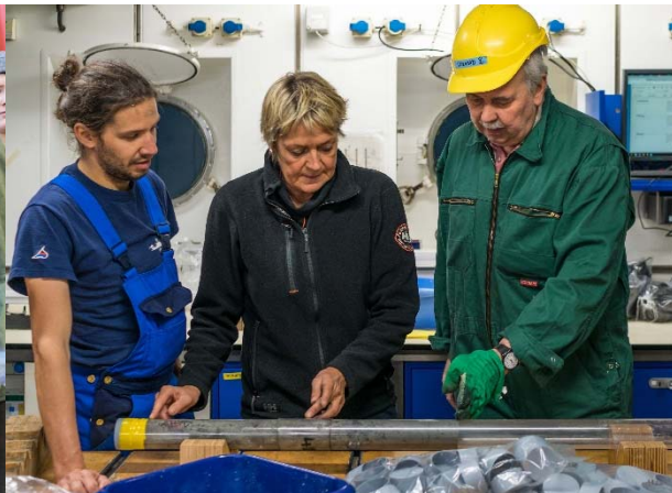
Abbildung 2: Im Geolabor wird der 3,8 m lange Sedimentkern in einzelne Segmente unterteilt und beschriftet, bevor er längsweits aufgeschnitten und in Archiv- und Arbeitshälfte unterteilt wird.

Während des gesamten Montags wurden hydroakustische Kartierungen bis zur rumänisch-ukrainischen Grenze im Osten durchgeführt. Am Abend brachen wir in Richtung Varna auf, wo wir am Dienstag, den 21. November um 09:00 an der uns schon bekannten Pier der Odessos-Werft anlegten. Bevor ein Teil der Wissenschaftler und des MeBo-Teams von Bord gingen, wurde noch schnell ein Gruppenfoto (Abb. 3) gemacht. Die Neueinsteiger kamen am Vormittag an Bord, so dass eine ausreichende Übergabe in den Laboren und an Deck des Schiffes stattfinden konnte. Viele nutzten die Gelegenheit am Abend die Stadt Varna zu besuchen, bevor die METEOR am Morgen des 22. 11. pünktlich um 09:00 zum 2. Teil der Forschungsreise aufbrach. Am Donnerstag wurden vor dem abendlichen MeBo-Einsatz mehrere Schwerelotkerne genommen. Zwei Lokationen mit aktiven Gasaustritten am Meeresboden wurden beprobt und enthielten deutlich dünne Gashydratlagen (Abb. 5), die schichtparallel in die eiszeitlichen Seesedimente eingelagert sind. Während der Eiszeit lag der Wasserspiegel des Schwarzen Meeres 150 m tiefer als heute, so dass kein salziges