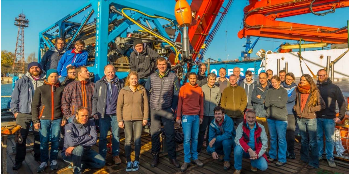
Abbildung 3: Wissenschaftliche Besatzung des ersten Abschnittes der M142 vor dem MeBo200 im Hafen.

Mittelmeerwasser über die 35 m tiefe Bosphorus-Schwelle aus dem Mittelmeer eindringen konnte, und das ehemalige Salzwassermeer durch die Süßwasserzuflüsse aussüßte.