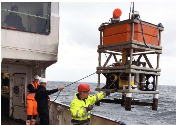
Abbildung 1: Der Gas-Lander wird vor seinem Einsatz am Schiffsdraht zu Wasser gelassen und einem Schwimmtest unterzogen.