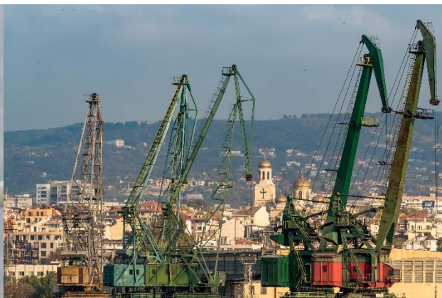
Abbildung 4: Blick von unserem Liegeplatz der Odessos Werft auf die Stadt Varna am Fuße und an den Hängen des Franga-Plateaus. Städtischer Mittelpunkt ist die Muttergottes-Kathedrale

Nachdem die CTD wieder an Bord der METEOR festgezurt und die Wasserschöpfer für weitere Analysen beprobt waren, ging der Gas-Lander zu Wasser. Dieser wurde am Schiffsdraht auf Tiefe geführt und 20 m über Grund durch einen akustisch ausgelösten Releaser freigegeben, so dass der Lander die letzten 20 m bis zum Meeresboden im Fall zurücklegte. Die Datenaufzeichnung begann einen Tag später in der Annahme, dass die durch den Lander verursachte Aufwirbelung am Meeresboden sich 24 Stunden später wieder zurückgebildet hat.