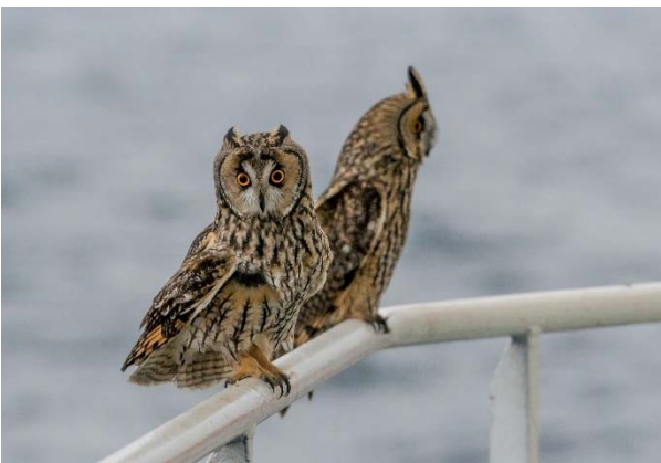
Abbildung 3: Zwei fliegende Gäste begleiteten uns während der 4-tägigen Test-Fahrt zurück nach Varna und lehrten uns, dass Eulen auch am Tag aktiv sein können.

Wie zuvor ging es über den bulgarischen Schelf zu einer Lokation östlich des Donau-Tiefseekanals in 1400m Wassertiefe, wo der Wissenschaftlich Technische Dienst WTD des Schiffes in der Nacht eine Kalibrierung der Unterwassernavigation POSIDONIA vornahm. Danach ging es zügig zur ausgesuchten Lander-Station in 665m Wassertiefe. Diese Lokation zeigte auf engstem Raum besonders viele Gasemissionen (Abb. 2), die über einen Zeitraum von mehreren Tagen mit dem Gas-Lander untersucht werden sollen. Zunächst wurde eine CTD mit Wasserschöpfern eingesetzt. Die Wasserproben aus 22 verschiedenen Wassertiefen zeigten das für das Schwarze Meer typische Methanprofil, etwa 10-20 nmol/L in den oberen 100 m der Wassersäule und darunter eine Zunahme der Methankonzentration auf einen Wert von 10.000 nmol/L, der auf diesem hohen Niveau bis in die tiefsten Becken des Schwarzen Meeres vorhanden ist. An der CTD-Station wurden allerdings in der Tiefe auch höhere Werte zwischen 12.000 und 15.000 nmol/L gemessen, die den direkten Einfluss der Methanemissionen am Meeresboden zeigten.