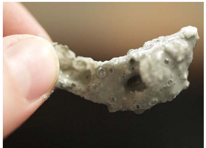
Abbildung 2: Vorbereitung von ROV QUEST auf dem Arbeitsdeck von FS METEOR. In der Tageshitze müssen immer wieder Teile des Roboters vor der unmittelbaren Sonneneinstrahlung geschützt werden (links). Gashydratstück aus dem ersten Schwerlotkern der Reise. Methanblasen und ein überdeckender Wasserfilm aus der Zersetzung des Gashydrates sind deutlich zu sehen (rechts; Bilder V. Diekamp, MARUM).

Schwerlotes das zuvor beobachtete Seepfeld zu beproben. Auch dies gelang auf Anhieb, denn das gesamte Schwerlot war durchsetzt von Gashydraten (Abb. 2), die sich oberflächennah im Bereich von Seeps aus dem aufsteigenden freien Gas des Untergrundes dort gebildet haben. Nach einer nächtlichen Vermessung wurde ein zweites Schwerlot zur geochemischen Detailbeprobung im Seepbereich genommen und danach begannen wir vorgezogen mit einem speziellen Beprobungsprogramm zur Untersuchung der Sauerstoffminimimumzone, da weitere Tauchgänge aufgrund der noch laufenden Reperaturarbeiten zunächst einmal zurückgestellt werden mussten. Bis auf wenige, leichte Erkältungsfälle sind alle Teilnehmer gesund und munter. Es grüßt im Namen aller Fahrtteilnehmer Gerhard Bohrmann FS METEOR, den 3. November 2007